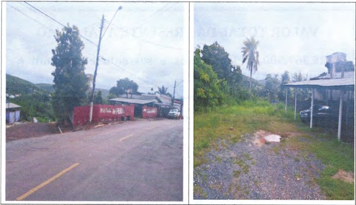
Imagens do imóvel urbano, matrícula n.º 6.003, com a área de 525,00m2, situado entre a junção da Rua Almirante Batista das Neves e Rua Des. Jo.aquim P. F. Mendes, centro.